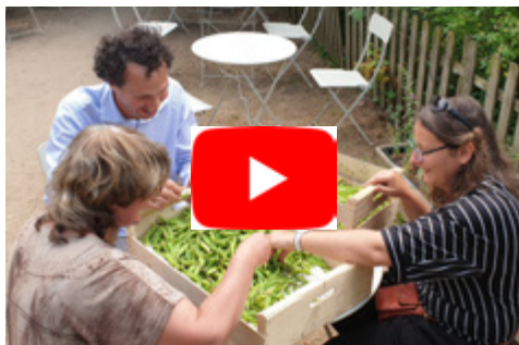
Des personnes exclues au cœur de la redynamisation des territoires «La Roseraie de Morailles » (45)