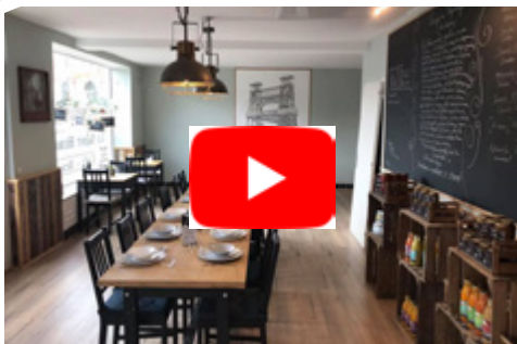
Présentation du tiers lieu nourricier «Le Ménadel & St Hubert » (Loos-en-Gohelle - 62)